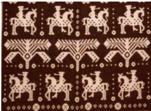
Detalj ur "Lurblåsarna" från 1980.

När kriget bröt ut var han orolig för vad som skulle hända. Han flyttade hem till Indal och lär senare ha sålt en av sina två damastvävstolar.